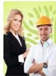
Сотрудник организации-партнера Экодиктанта

Категории отличаются по сложности вопросов: от низкой (для подростков 12-17 лет) до высокой (для экспертов, студентов, специалистов, руководителей в экологической сфере).