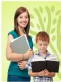
Подростки 12-17 лет