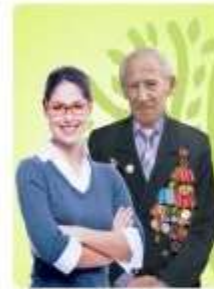
Без профильного образования возраст старше 18 лет