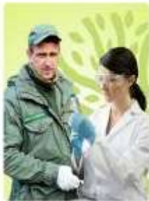
Эксперт, студент, специалист, руководитель в экологической сфере