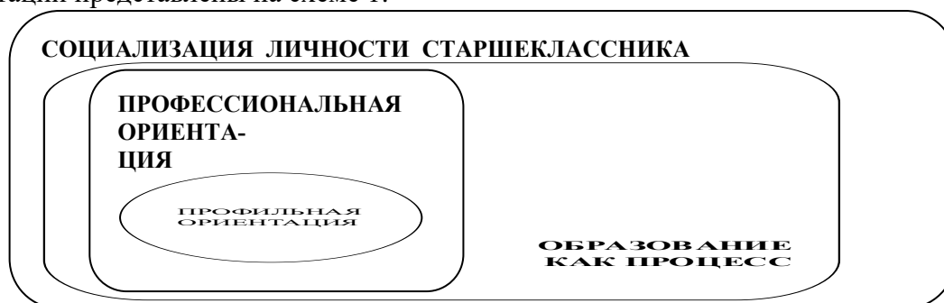
Схема 1. «Соотношение профильной и профессиональной ориентаций»

Мы считаем, что профильная ориентация уже понятия профессиональная ориентация и является ее составной частью, что отражено на схеме. Взаимосвязь профильной и профессиональной ориентаций представлены на схеме 1.