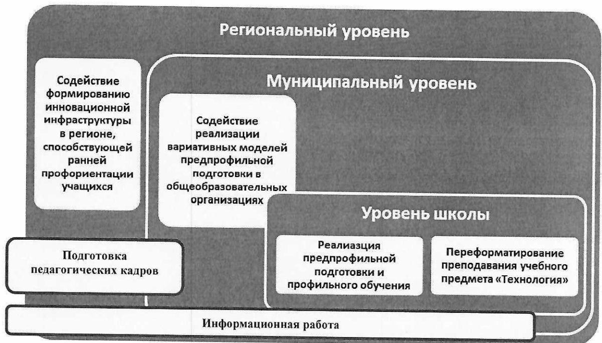
Схема 1. Приоритетность запуска механизмов ранней профориентации на разных уровнях региональной системы образования

обозначены уровни запуска того или иного механизма ранней профориентации школьников: