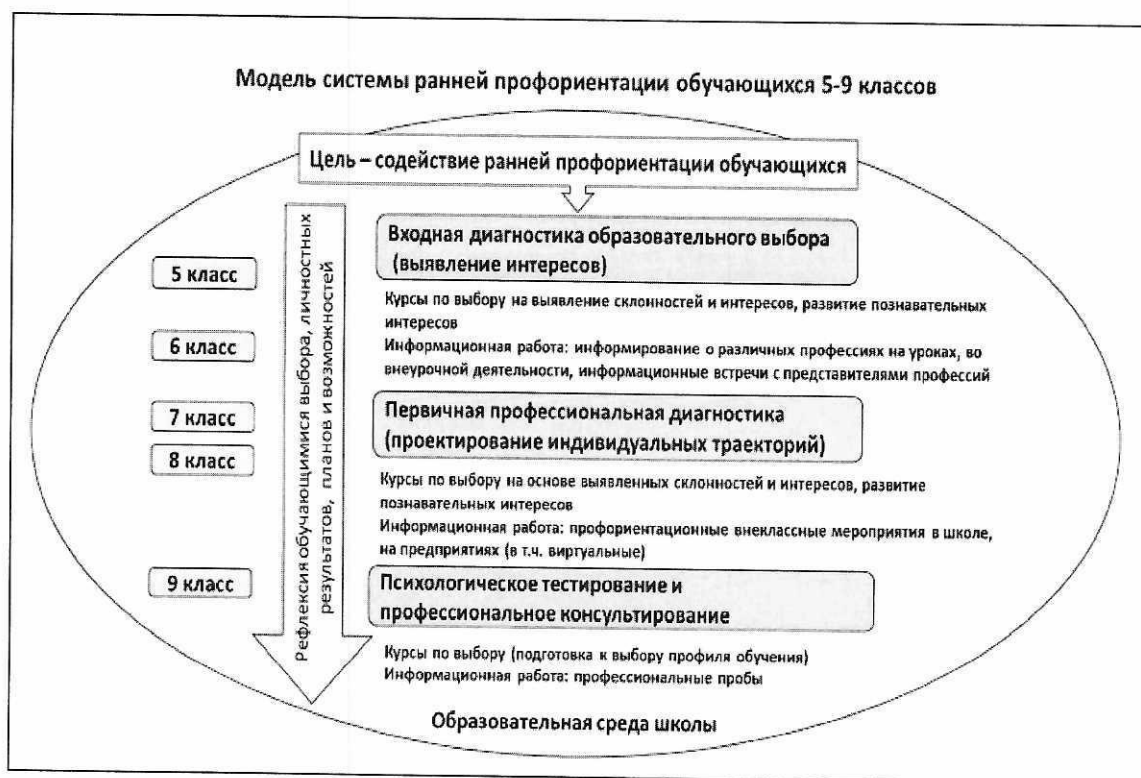
Схема 3. Модель системы ранней профориентации обучающихся 5-9 классов

Схематически модель системы ранней профориентации может быть изображена следующим образом (схема 3):